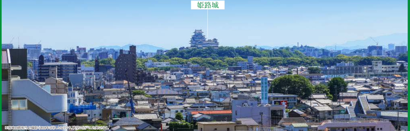
※現地10階相当の撮影は2018年5月10日撮影のものです。眺望は住戸により異なります。